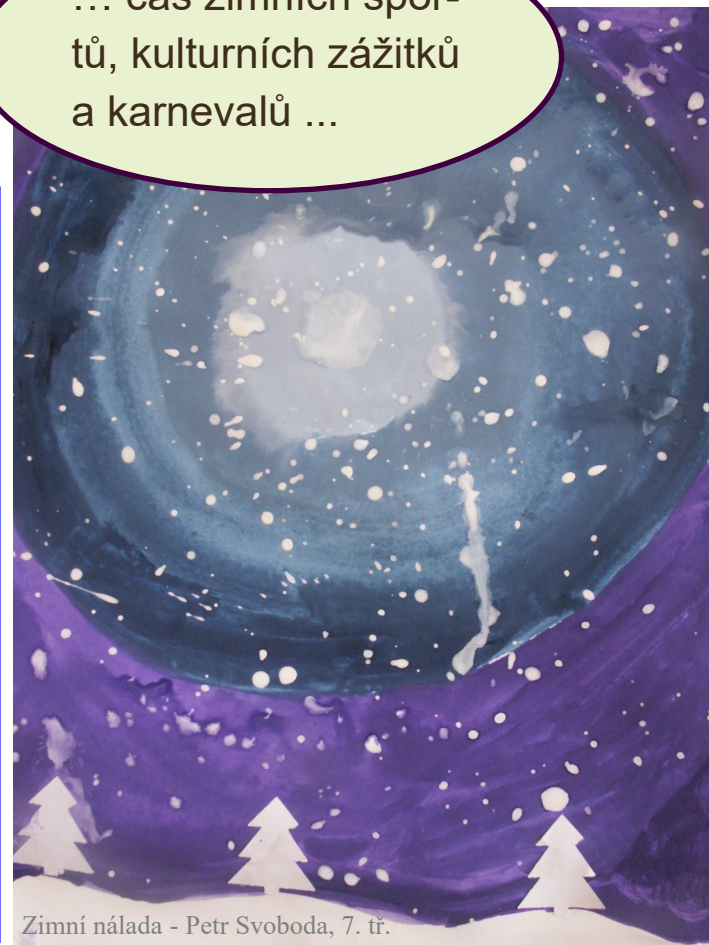
Zimní nálada - Petr Svoboda, 7. tř.

(Ostrov, kde rostou housle - úryvek básně)