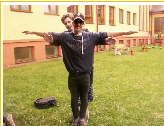
Okénko našich devátáků :-)