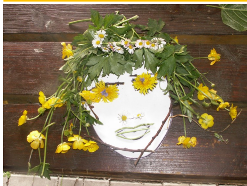
Výtvarná výchova v 9. třídě má různou podobu ...