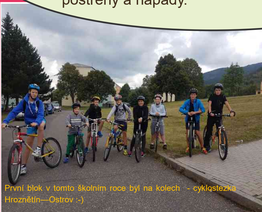
První blok v tomto školním roce byl na kolech - cyklostezka Hroznětín—Ostrov :-)