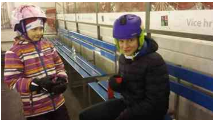
Bruslení na Zimním stadionu v Ostrově.