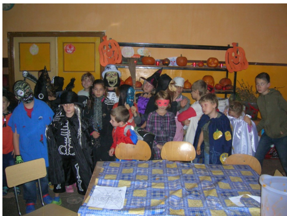
21.10. - Blok Halloween