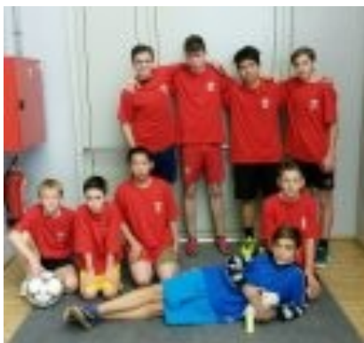
Halový fotbal—hoši naší školy získali krásné 3. místo v Hale míčových sportů v Karlových Varech