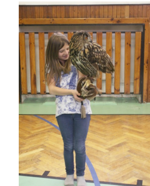
Přednáška o dravcích.

Na měsíc leden vyhlášíme novou soutěž „Nejhezčí PF 2016.“ Můžeš vyrobit, nakreslit, vyfotit ... Pf odevzdávejte v kanceláři školy do 22.1.2016