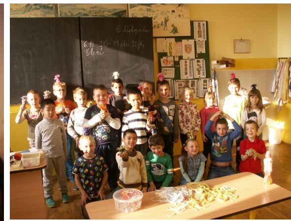
Žáci připravovali výrobky na vánoční jarmark.

27. října pořádala naše škola lampionový původ tentokrát za doprovodu bubenického souboru ZUŠ Ostrov. Na závěr jsme všichni společně vypustili lampion štěstí. Všem zúčastněným moc děkujeme a již teď se moc těšíme na lampionový průvod v příštím roce.