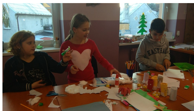
Naši žáci ve školní družině.