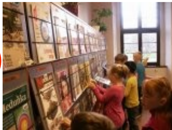
Návštěva Městské knihovny v Ostrově-naši třetáči .