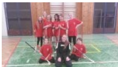
Florbal dívky—výborné 2. místo na ZŠ Truhlářská v Karlových Varech